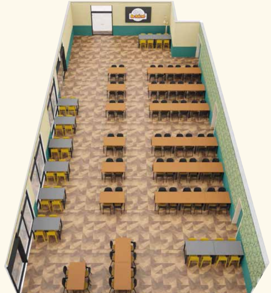
Configurations possibles dans la salle Pavillon 1900