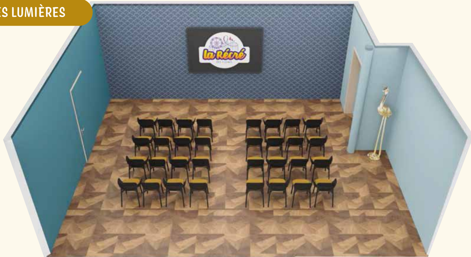
Configurations possibles dans la salle Pavillon 1900